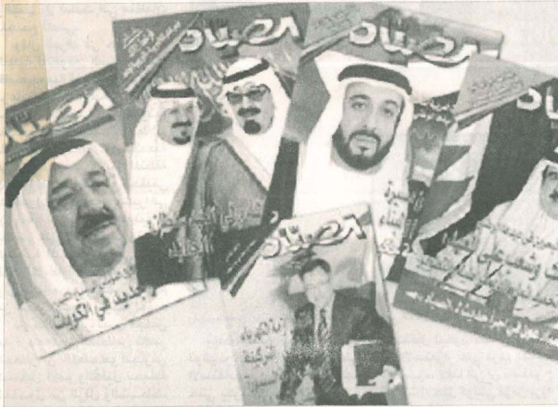
مجموعة من إصدارات مجلة الصياد

لابد أن تكون صحافة «دار الصياد» رائدة التصنيع الإعلامي مع التزامها بالأهداف فصناعة الرأي العام لا تقل أهمية عن تفعيل الرسالة الإنسانية