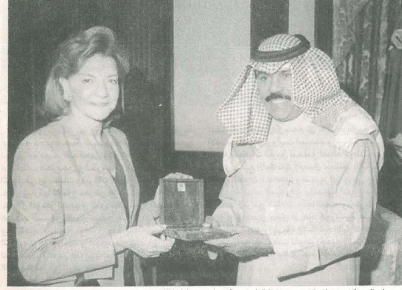
سمو ولي العهد الشيخ نواف الاحمد مستقبلا الهام فريحة في احدى زيارتها للكويت

وجود لبنان في القمة مسألة أساسية لابد منها لأسباب إستراتيجية ولوجود إصرار عربي وتخفيف تفاقم الصراعات العربية واللبنانية والدولية طبول الحرب تقرر بين الولايات المتحدة الأميركية والجمهورية الإسلامية الإيرانية ولبنان لن يكون على هامش الحرب والصراع الذي يتميز بأنه حام وخطير